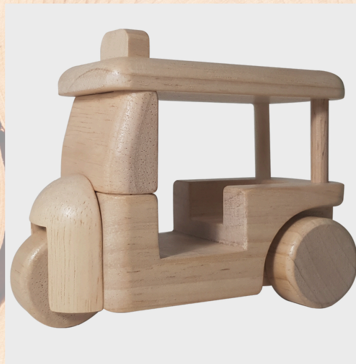
ワークショップキット（未完成品）