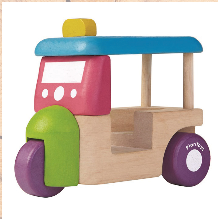
通常の商品（完成品・塗装済み）

プラントイ社の商品【トウクトウク】は、通常完成品で塗装済みですが、今回のキットはあえて未完成品（未組立・未塗装）をプラントイ社にご用意いただき、自由に色を塗ってオリジナルのトウクトウクを作ることが出来る商品となっています。（キットは非売品で、通常の流通では販売していません）