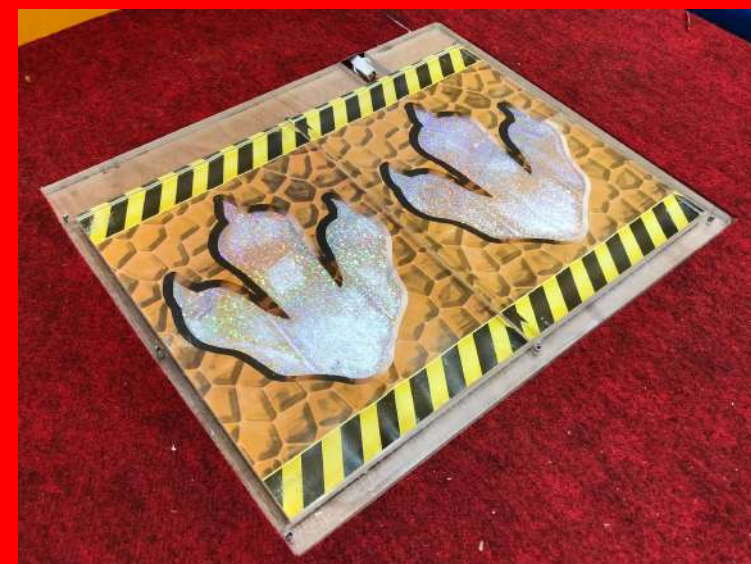
専用フットパネル画像（1-6共通）

フットパネルは、子どもたちがパネルの左右の恐竜足跡マークを足で踏むことによって画面上の恐竜が走ることが出来る機材です。対荷重制限はおおよそ50kgですので基本的には子どもを前提としておりますが、大人が踏む事も可能です。最大6人同時に走行することが可能です。