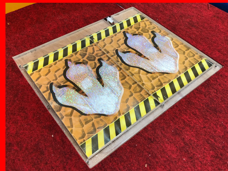
専用フットパネル画像（1-6共通）

フットパネルは、子どもたちがパネルの左右の恐竜足跡マークを足で踏むことによって画面上の恐竜が走ることが出来る機材です。対荷重制限はおおよそ50kgですので基本的には子どもを前提としておりますが、大人が踏む事も可能です。最大6人同時に走行することが可能です。