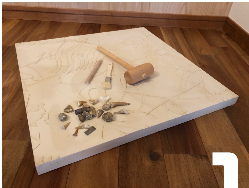
①化石発掘体験プレート (化石50人体験分) ハンマー・ノミ・ハケ・化石カタログ50枚・持ち帰り用袋入り