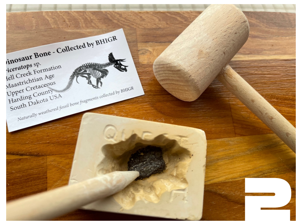
②プレミアム化石発掘体験 トリケラトプスの化石発掘体験 (50人体験) ・ブラックヒルズ研究所※の鑑定書付き (ハンマー・ノミ・ハケ・袋は同梱されていません)