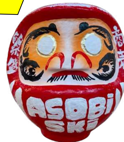
世界でひとつだけの祈願成就高崎だるまの完成です！