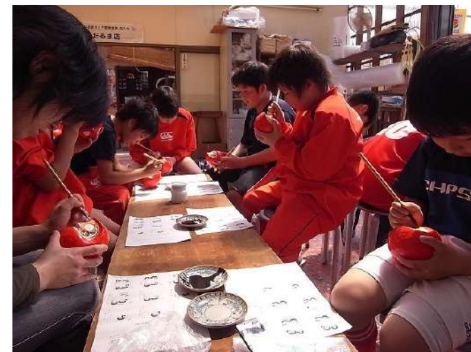
絵付け体験の様子 （画像は今井だるま店 工場でのワーク ショップの様子 です。）