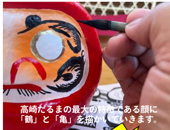
高崎だるまの最大の特徴である顔に「鶴」と「亀」を描かれています。

※落ちにくい塗料が付着することがありますので、汚れてもいい服装でお越しください。