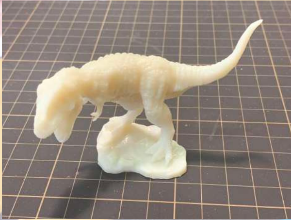
●ティラノサウルス