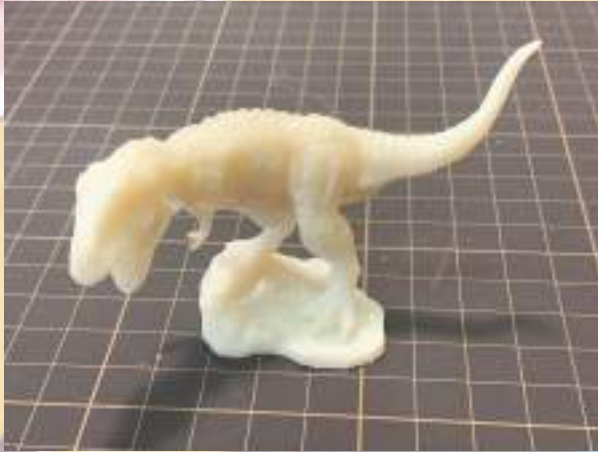
●ティラノサウルス